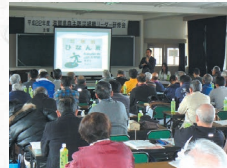
多言語標示の具体例の紹介