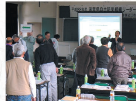
さて、どちらの標示に従って避難しますか?