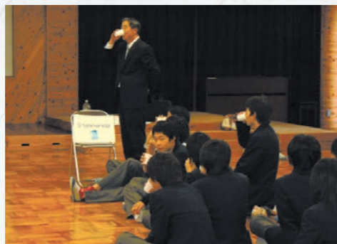
意味がわからない標示の付いた水を飲む体験風景