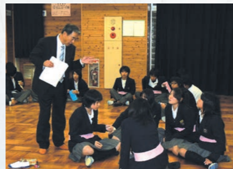
カラーベルトは、お腹を壊してしまった人という目印